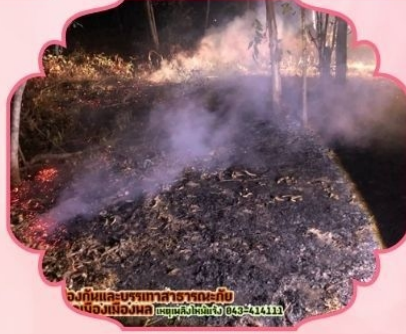
ป้องกันและบรรเทาสาธารณภัย เมืองเมืองพล โทร.043414111

จัดทำโดย : งานประชาสัมพันธ์ กองยุทธศาสตร์และงบประมาณ เทศบาลเมืองเมืองพล