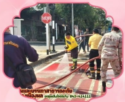
และบรรเทาสาธารณภัย เมืองพล (ศูนย์สั่งการแจ้ง) 043-414111