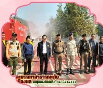
และบรรเทาสาธารณภัย เมืองพล (ศูนย์สั่งการแจ้ง) 043-414111