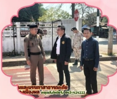
และบรรเทาสาธารณภัย เมืองพล (ศูนย์สั่งการแจ้ง) 043-414111