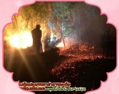
ป้องกันและบรรเทาสาธารณภัย เมืองเมืองพล โทร.043414111