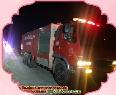
ป้องกันและบรรเทาสาธารณภัย เมืองเมืองพล โทร.043414111