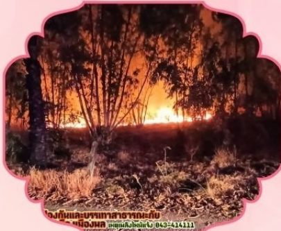
ป้องกันและบรรเทาสาธารณภัย เมืองพล โทร.043414111

วันที่ 1 มกราคม 2568 เวลา 22.10 น.งานป้องกันและบรรเทาสาธารณภัยเทศบาลเมืองเมืองพล นำรถบรรทุกน้ำวารี 5 เข้าระงับเหตุเพลิงไหม้ป่ายูคาลิปตัส ปากบ้านหนองพง ตำบลเก้าจิว -รอยต่อบ้านวังจาม ตำบลหนองแวงนางเข้า ร่วมกับงานป้องกันและบรรเทาสาธารณภัยองค์การบริหารส่วนตำบลเก้าจิว,งานป้องกันและบรรเทาสาธารณภัยองค์การบริหารส่วนตำบลหนองแวงนางเข้า,งานป้องกันและบรรเทาสาธารณภัยองค์การบริหารส่วนตำบลโจดหนองแก และสมาคมวี อาร์ กู้ภัยมิตรภาพเมืองพล