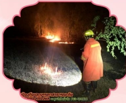
ป้องกันและบรรเทาสาธารณภัย เมืองเมืองพล โทร.043414111