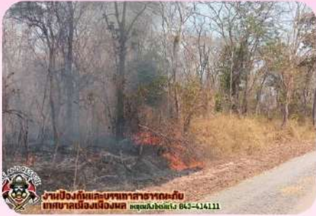
งานป้องกันและบรรเทาสาธารณภัย เทศบาลเมืองเมืองพล โทรแจ้งเหตุ 043-414111