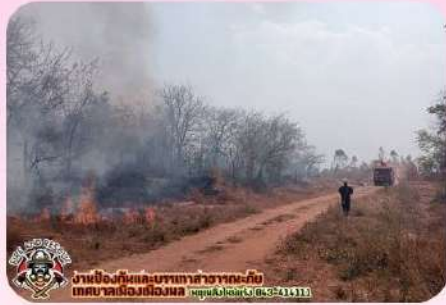
งานป้องกันและบรรเทาสาธารณภัย เทศบาลเมืองเมืองพล โทรแจ้งเหตุ 043-414111