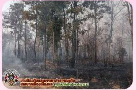
งานป้องกันและบรรเทาสาธารณภัย เทศบาลเมืองเมืองพล โทรแจ้งเหตุ 043-414111

วันที่ 16 กุมภาพันธ์ 2568 เวลา 13.10 น. งานป้องกันและ บรรเทาสาธารณภัยเทศบาลเมืองเมืองพล นำรถบรรทุกน้ำ วารี 5 เข้าระงับเหตุเพลิงไหม้ป่าบริเวณท้ายหมู่บ้านเพ็ญน้อย พื้นที่องค์การ บริหารส่วนตำบลโสภณนุกเต็น อำเภอพล จังหวัดขอนแก่น ร่วมกับ งานป้องกันและบรรเทาสาธารณภัยองค์การบริหารส่วนตำบลโสภ ณนุกเต็น ใช้เวลาประมาณ 1 ชั่วโมงจึงควบคุมเพลิงไว้ได้